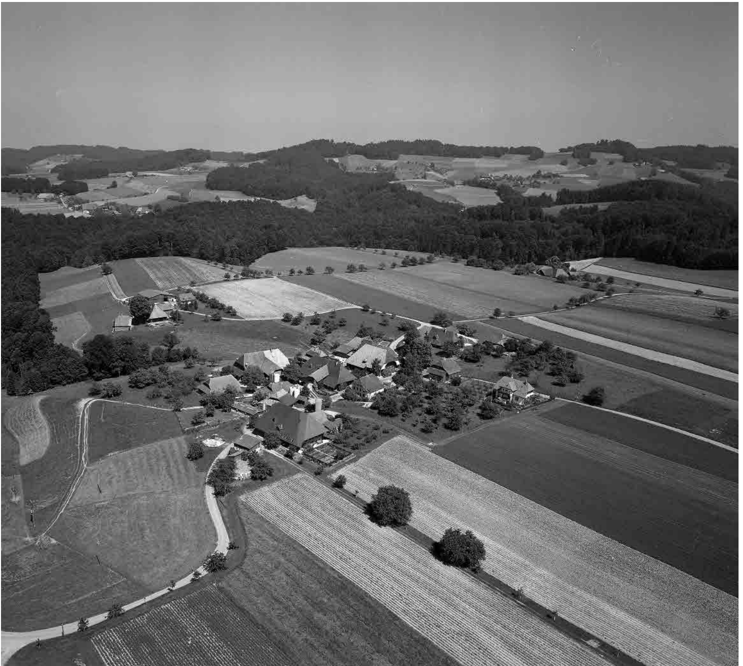
Flugbild 1986, © Luftbild Schweiz, Dübendorf

Kompakte, unverbaute Gehöftgruppe mit von weitem sichtbarer, von Obstbäumen umrahmter Dachlandschaft in den sanften Hügeln des unteren Emmentals. Annähernd orthogonales Siedlungsmuster mit geschlossenem ländlichem Strassenraum.