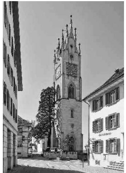
9 Neugotischer Kirchturm, 1860–63