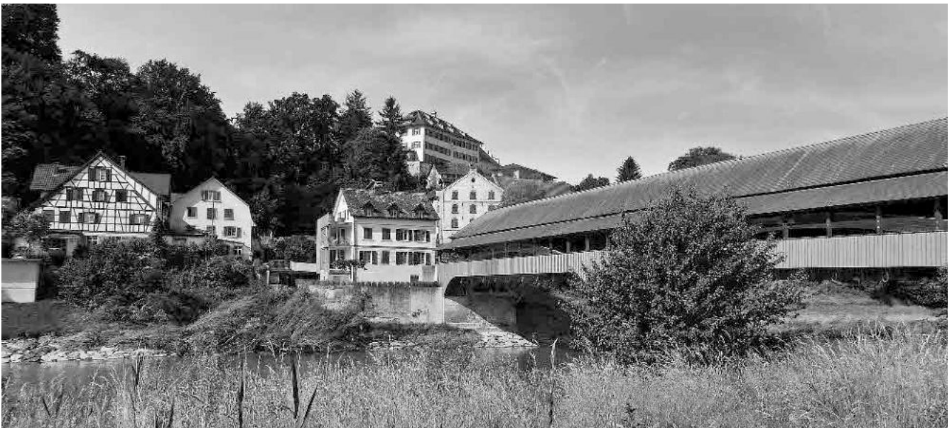
32 Zweijochige Thurbrücke mit Walmdach, 1814/15, am Brückenkopf klassiz. Zollhaus, 1817