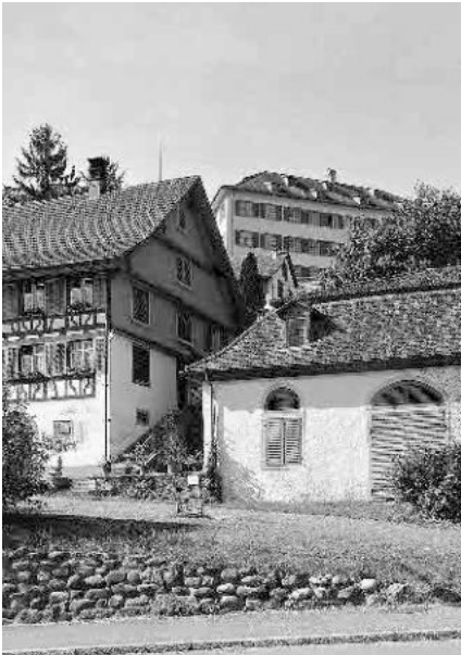
30 Ökonomiegebäude, 1780