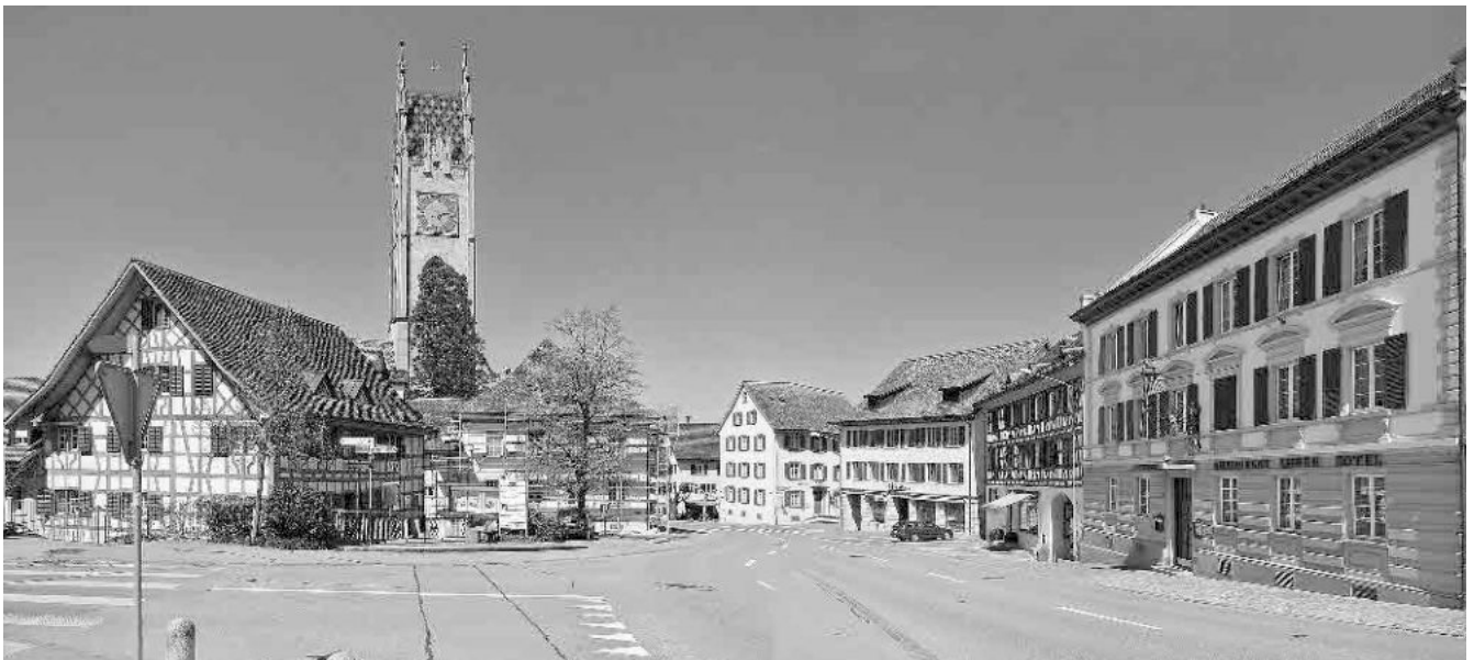
5 Hotel «Löwen», ehem. Gasthöfe «Löwen» und «Bären», 1838