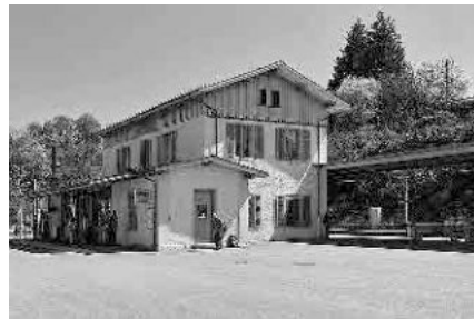
3 Stationsgebäude, 1870