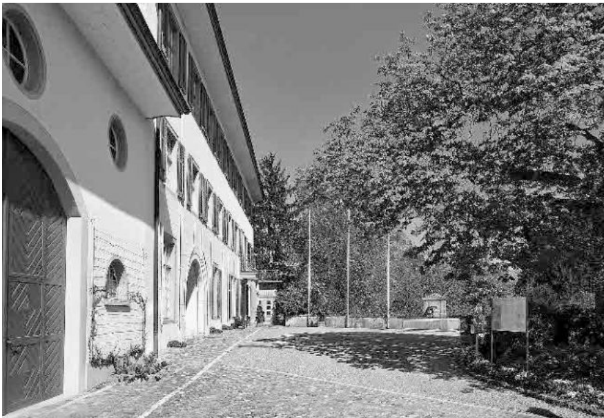
13 Schloss von 1780–82