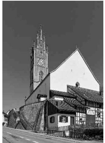
23 Ref. Kirche, 1666/67