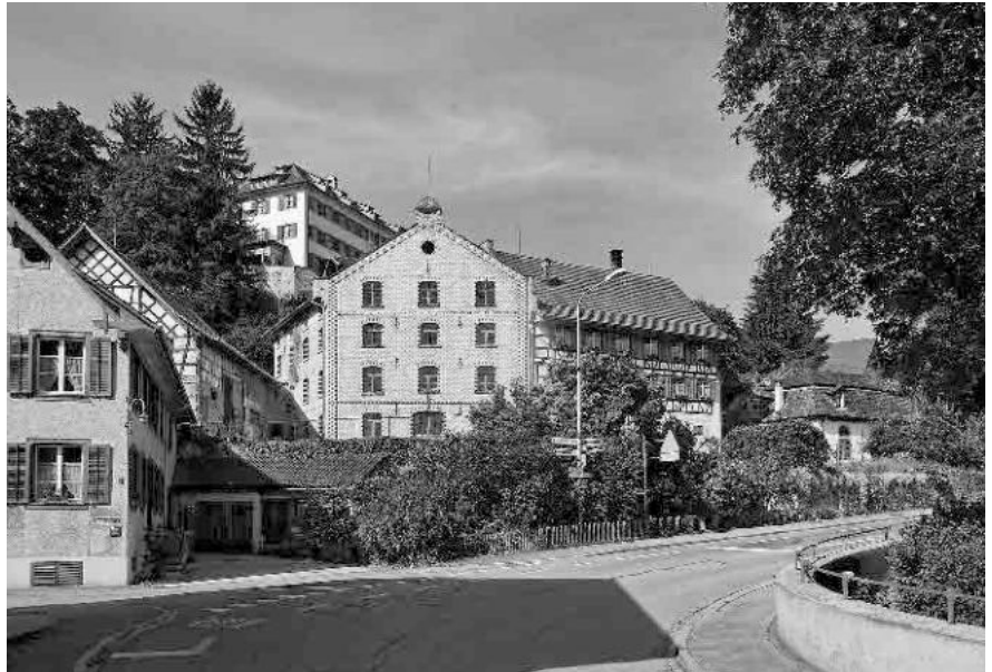
31 Haldenmühle, Mischbau mit Sichertiegel, 1800, Backsteinbau, 1843