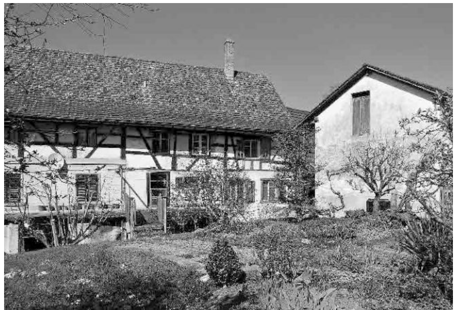
19 Brücke über den zwischen den Häusern offen fliessenden Wildbach