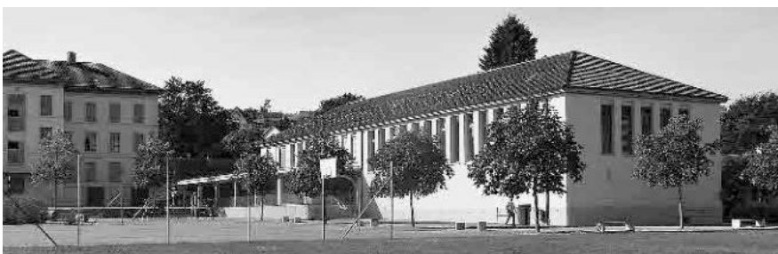
26 Schulanlage Hofwiesen, Turnhalle mit Schulräumen, 1934