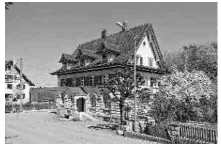
4 Ehem. Bank, 1915