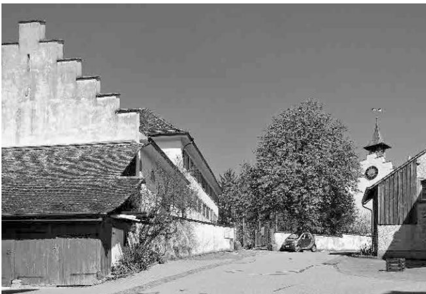
15 Ehem. Schlossscheune, im Kern 1546