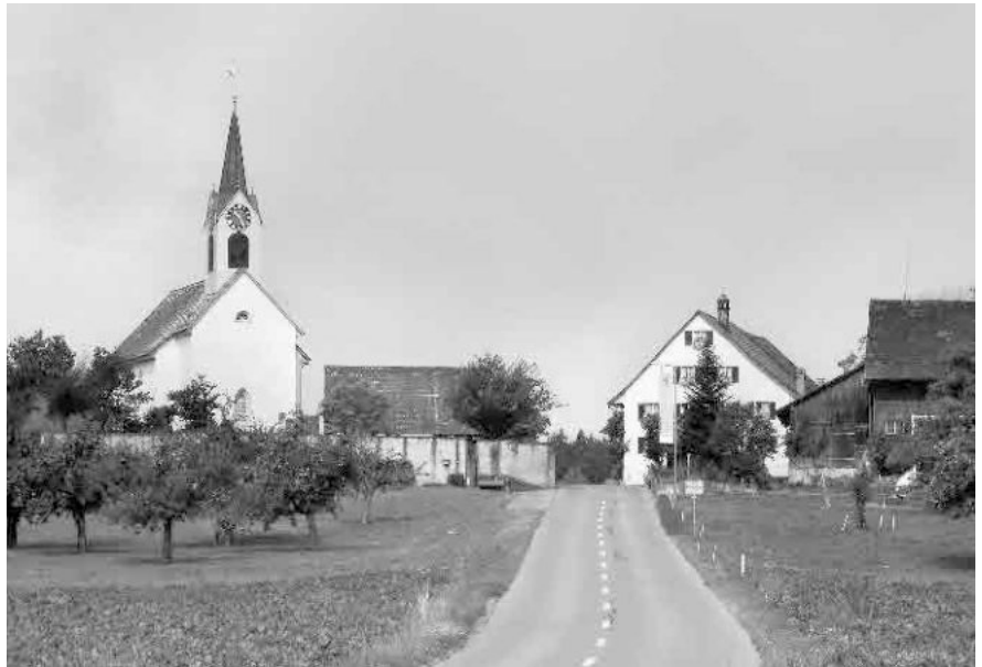
1 Pfarrkirche, ab 10./11. Jh.