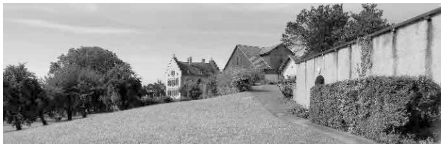
2 Pfarrhaus mit Treppengiebel, 1868-71