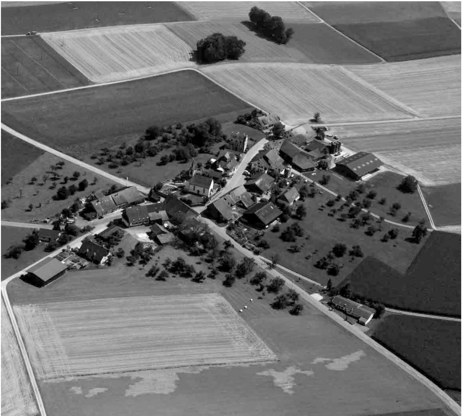
Flugbild Simon Vogt 2012, © Kantonsarchäologie Zürich

Kompakte Strassensiedlung auf Hügelgrat, allseitig umgeben von sanft gewelltem Kulturland. Erkennungszeichen des historisch und geografisch ins Weinland orientierten Acker- und Weinbauernweilers sind die weit herum sichtbare Kirche und das Pfarrhaus mit neugotischem Treppengiebel.