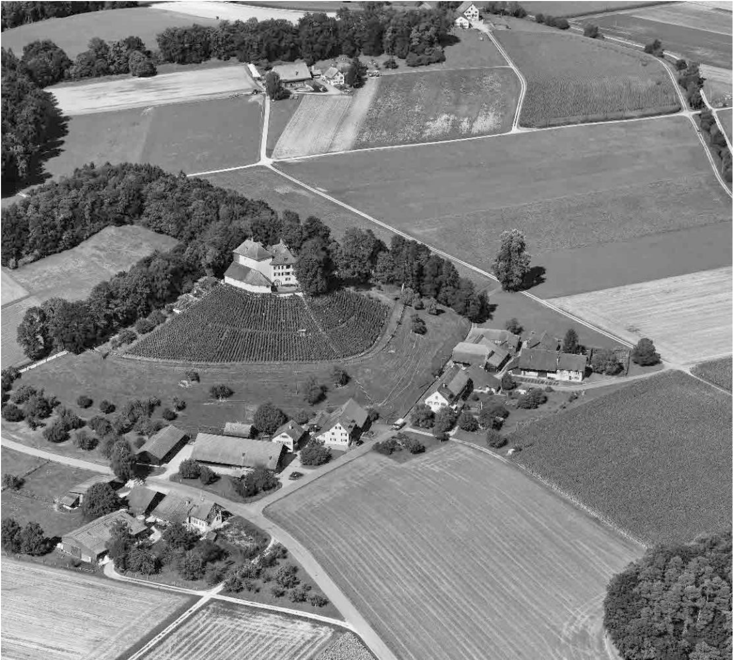
Flugbild Simon Vogt 2012, © Kantonsarchäologie Zürich

Schlossanlage mit mittelalterlichem Turm und spätbarockem Wohntrakt in beeindruckender Lage auf der Kuppe eines markanten Hügels und an dessen Fuss situierte Hofgruppe mit reizvoll gestaffelten Bauernhäusern. Spannungsvolles Zusammenspiel zwischen Bauten und Landschaft.