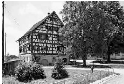
7 Furtmühle, 1635