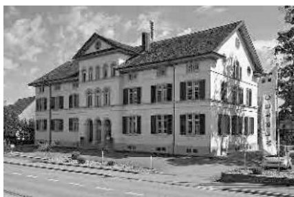
2 Ehem. Schulhaus, 1863/64