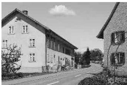
9 Vorposten in Richtung Gütinghausen