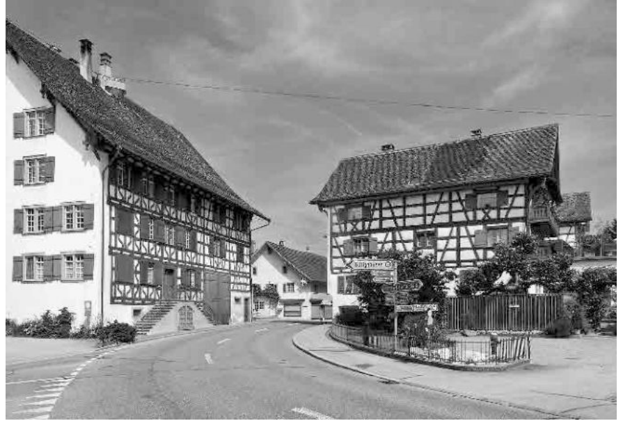
7 Sog. Doktorhaus, 1718, und ehem. Gasthaus und Metzgerei «Rössli», 1669/70