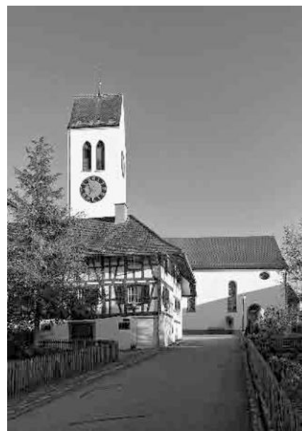
13 Pfarrkirche, 1651, Turm von 1662