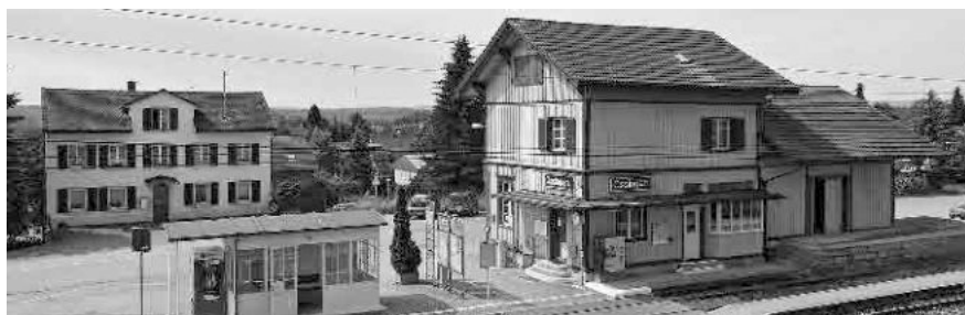
18 Stationsgebäude, 1880, Güterschuppen, 1875