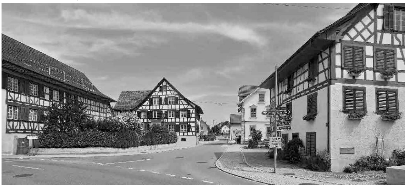
4 Gemeindehaus, 1794–97 als Schulhaus erbaut