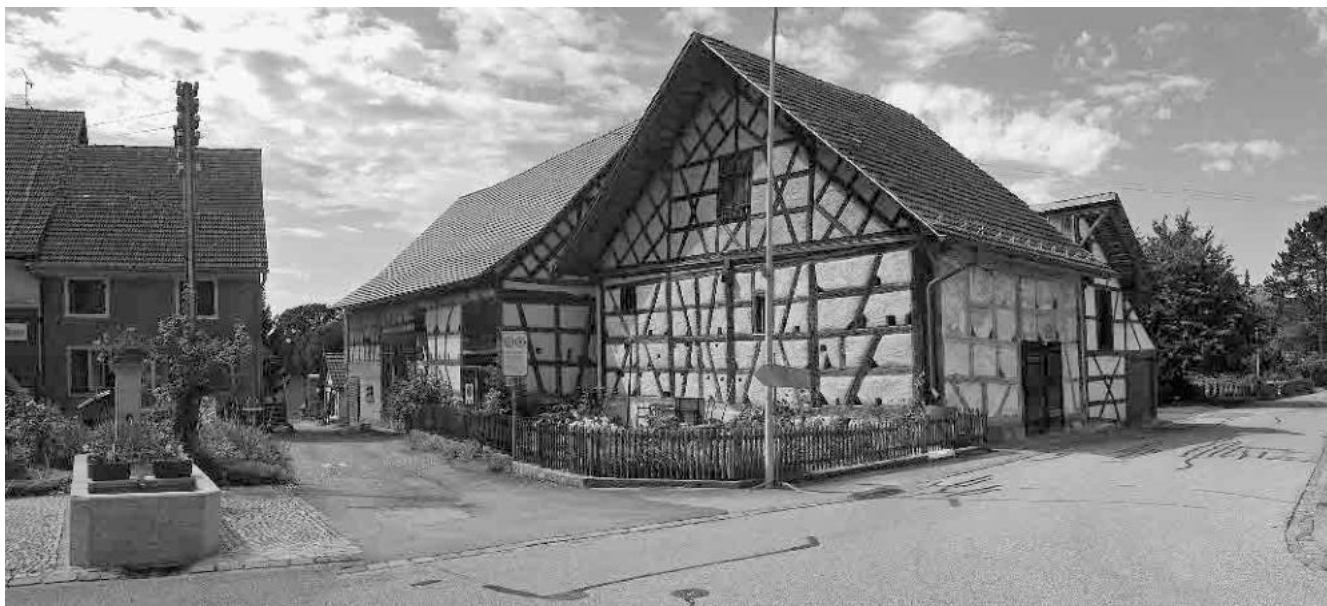
16 Aneinandergebaute Trotten, 18. Jh.