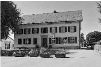
15 Primarschulhaus, 1849