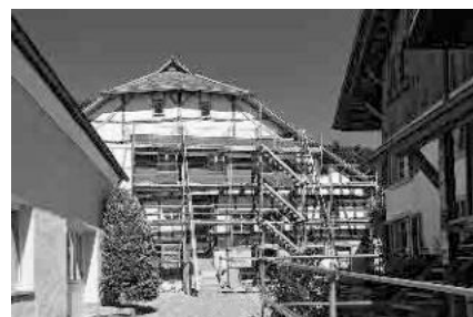
4 Sog. Girsbergerhaus, 15. Jh.