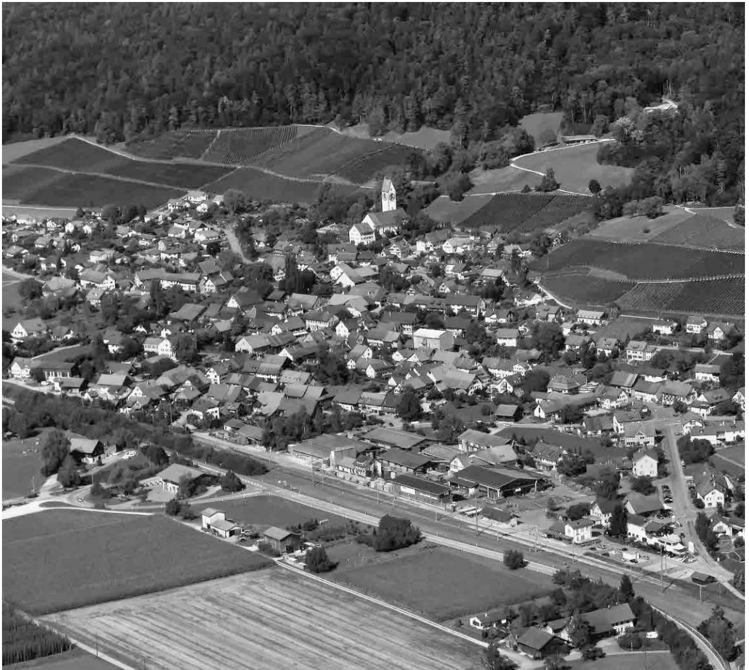
Flugbild Simon Vogt 2012, © Kantonsarchäologie Zürich

Grosses Wein- und Ackerbauern- dorf in weitwirksamer Lage am Hang des Stammerbergs mit wert- vollen, dicht gereihten oder ge- stapelten Vielzweckbauten an hang- parallelen und in der Falllinie des Hangs verlaufenden Strassen. Erhöht gelegene Pfarrkirche mit gotischem Käsbissenturm.