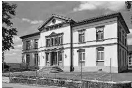
16 Oberstufenschulhaus, 1893/94