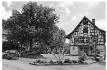
12 Gemeindehaus, 1531