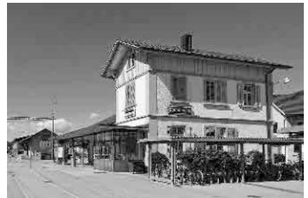
17 Bahnhof Stammheim, 1875