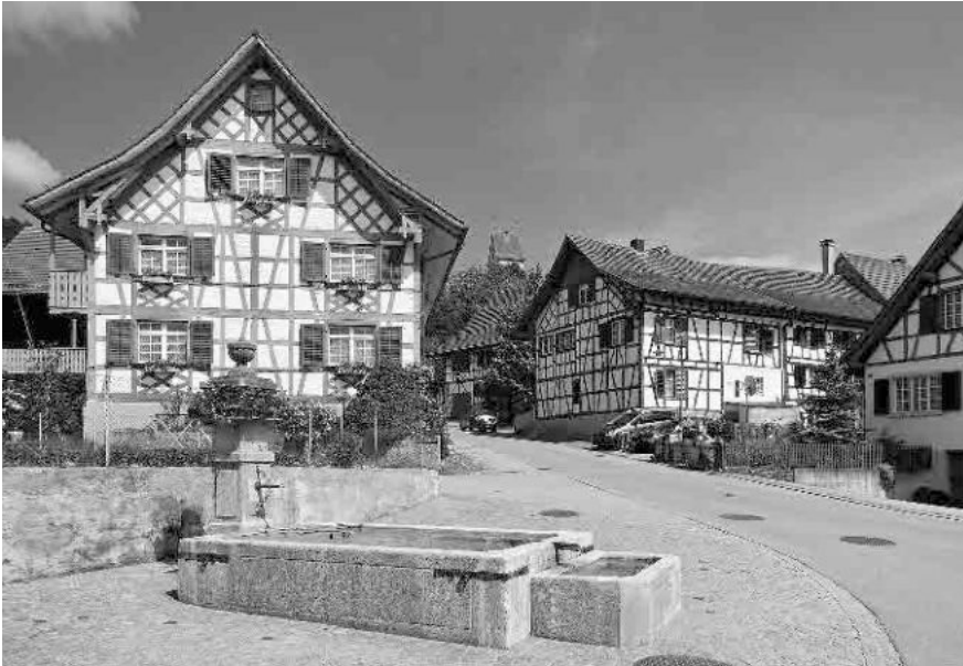
6 Brunnen im Spickel Kehlhofstrasse/Möhe, 1859