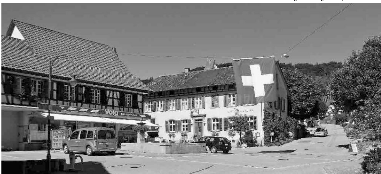
5 Dorfplatz mit Brunnen von 1841