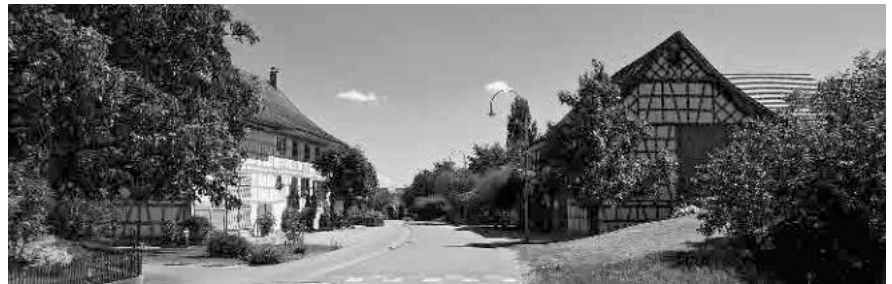
8 Nördlicher Ortseingang