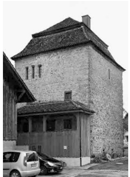
7 Wohnturm, 12. Jh., jetzt Ortsmuseum