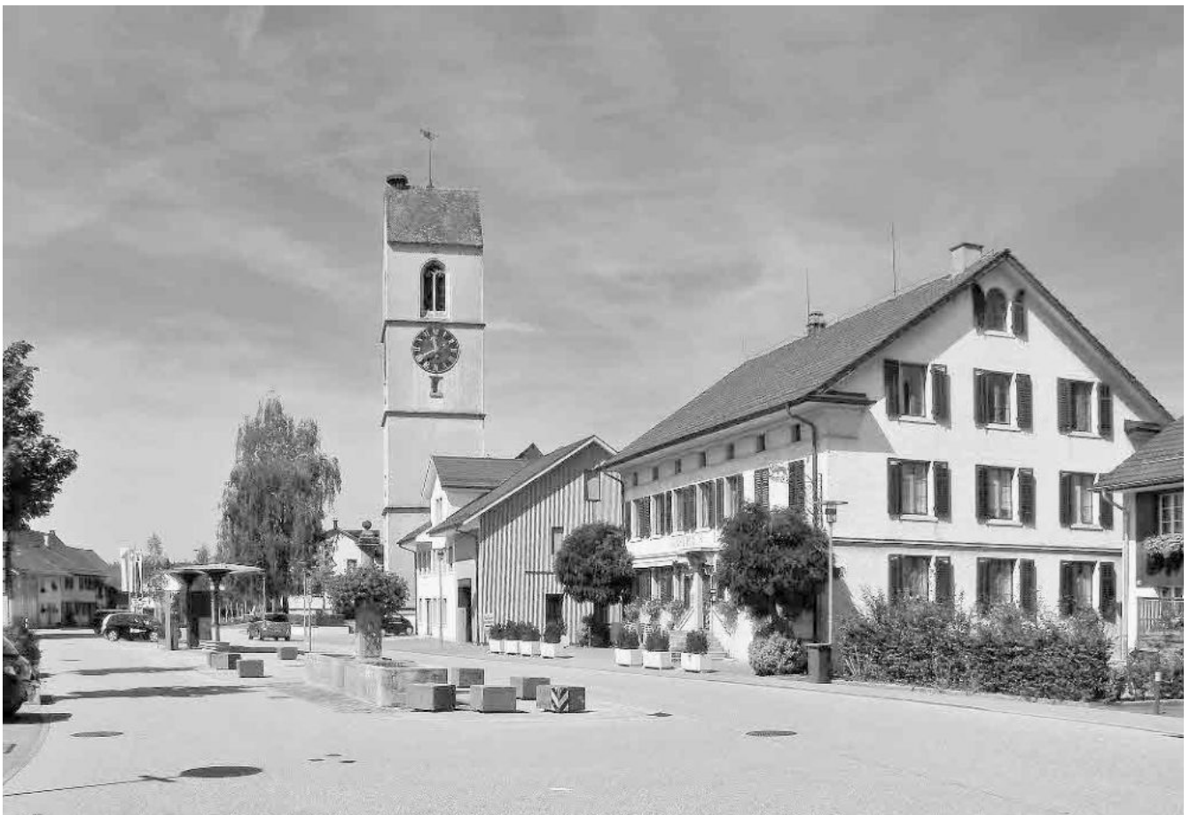
2 Gasthof «Löwen», 1864