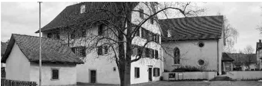
8 Altes Pfarrhaus mit Waschhaus, 1766/67