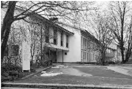
11 Sekundarschulhaus, 1957