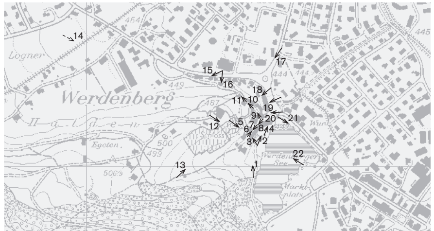
Fotostandorte 1: 10 000 Aufnahmen 1998: 1-22