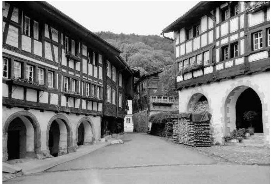
8 Ehemaliges Marktplätzchen