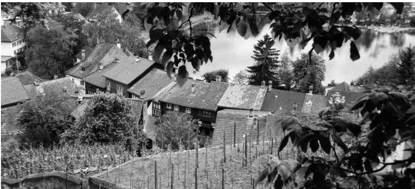
5 Blick von der Schlossterrasse