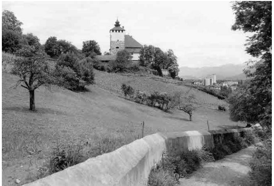
13 Geländesporn mit Schloss aus 13.-17. Jh.