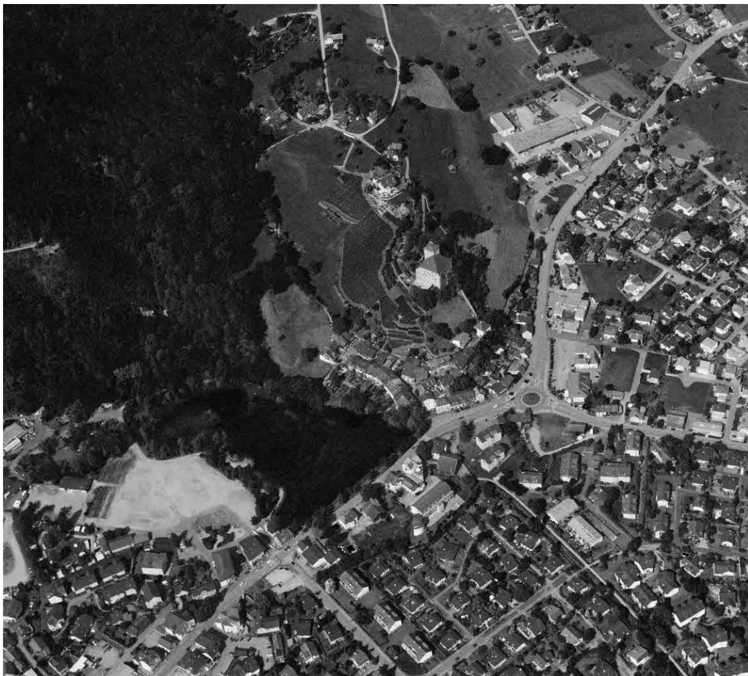
Flugbild Bruno Pellandini 2008, © BAK