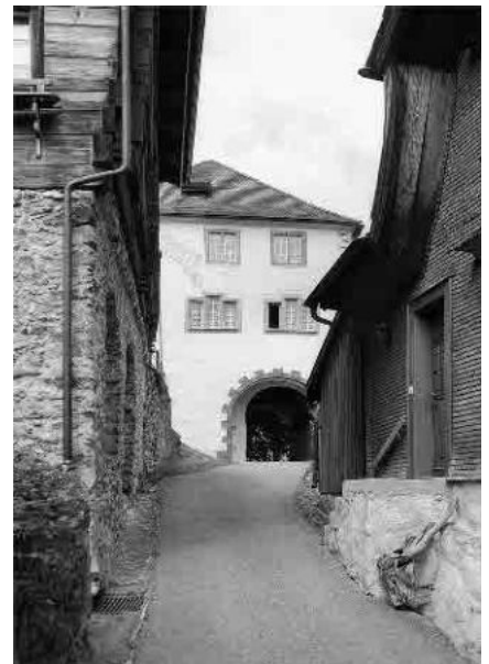
11 Rathaus, erb. nach 1478