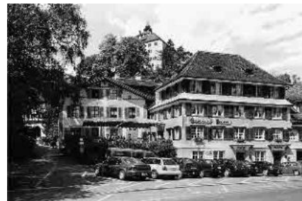
20 Gasthof «Rössli»