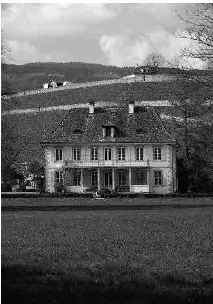
10 Ancienne maison Barbier