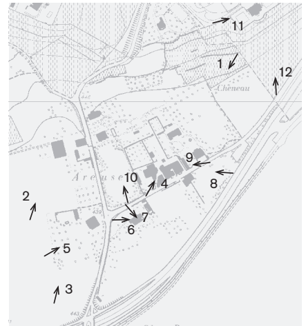
Direction des prises de vue 1: 10 000 Photographies 2008: 1–12