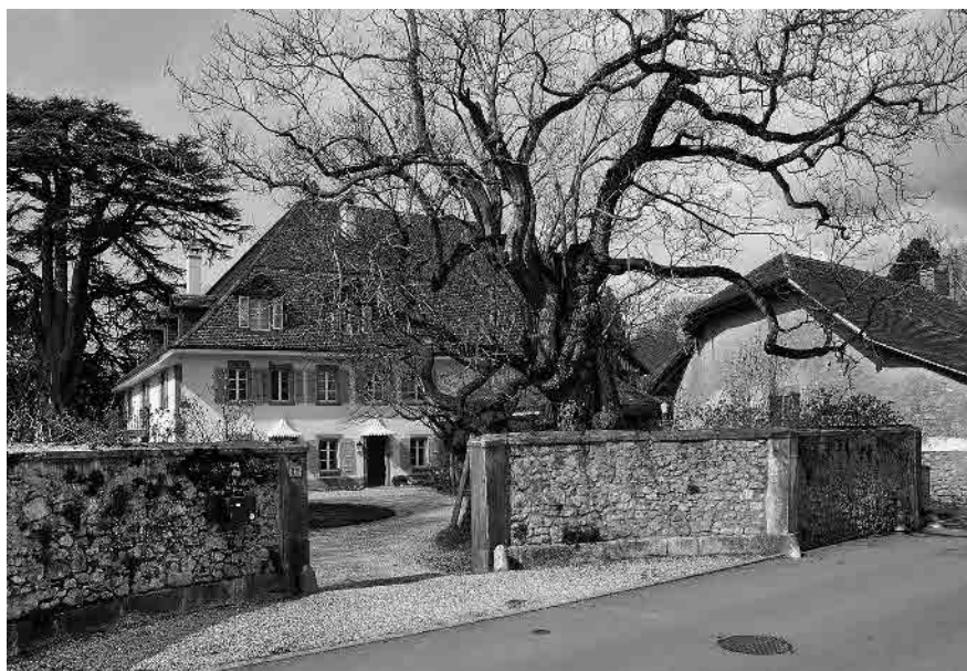
4 Maison de la Ratière