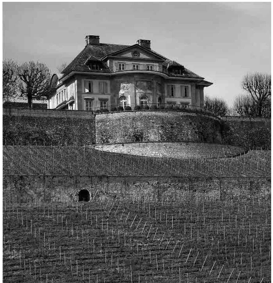
12 Château de Vaudijon