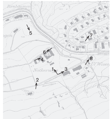
Plangrundlage: Übersichtsplan des Kantons St. Gallen UP5, © Benützung der Daten der amtlichen Vermessung durch die kantonale Vermessungsaufsicht bewilligt, 18. September 2012 Fotostandorte 1 : 10 000 Aufnahmen 2011: 1-8