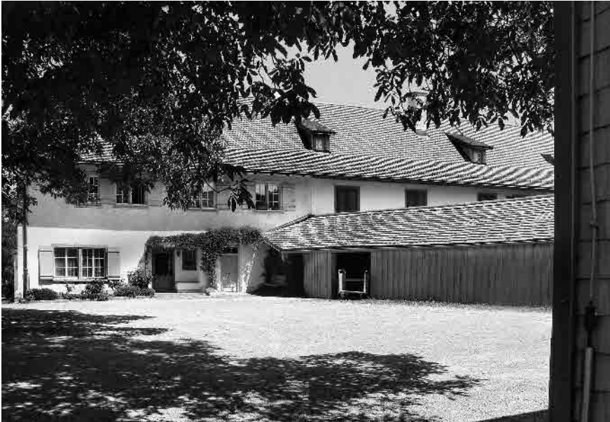
4 Ehem. Gästehaus, 1715