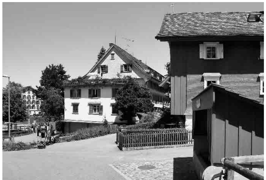
8 Eggerhof, ab 1665