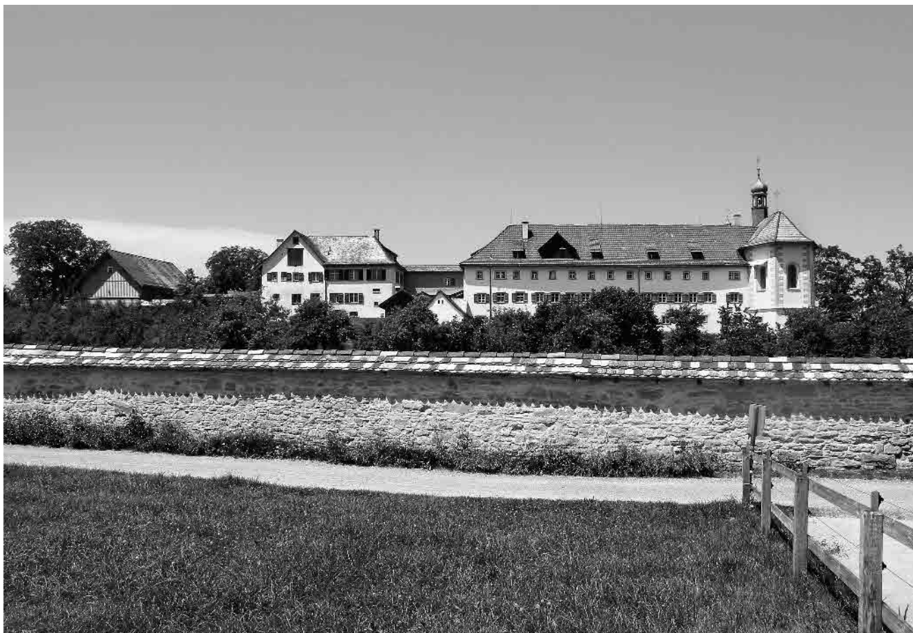
1 Kapuzinerinnenkloster, 1718–20 Wiederaufbau nach Brand

Gemeinde St. Gallen, Wahlkreis St. Gallen, Kanton St. Gallen