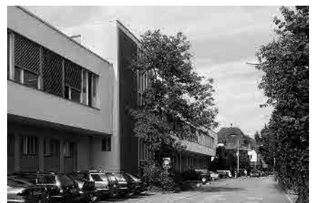
53 Ringstrasse, Fabrikgebäude ab 1961