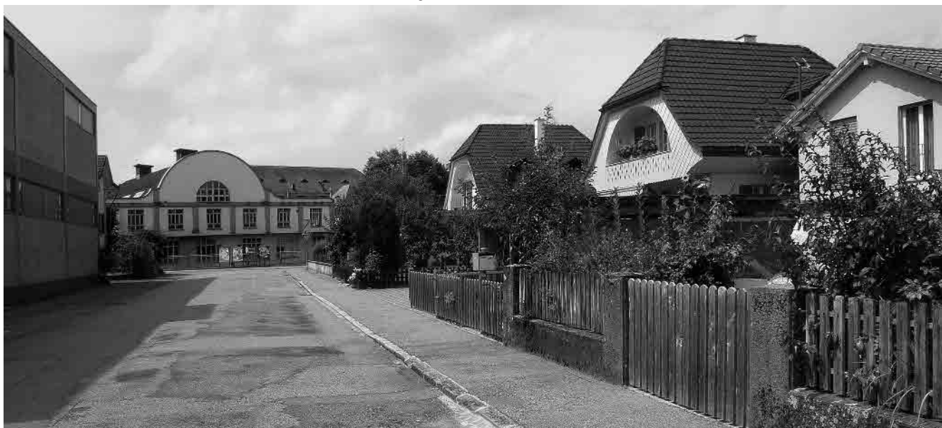
60 Porzellanstrasse, Isolatorenhalle