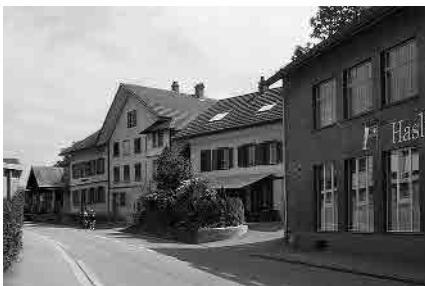
19 St. Urbanstrasse