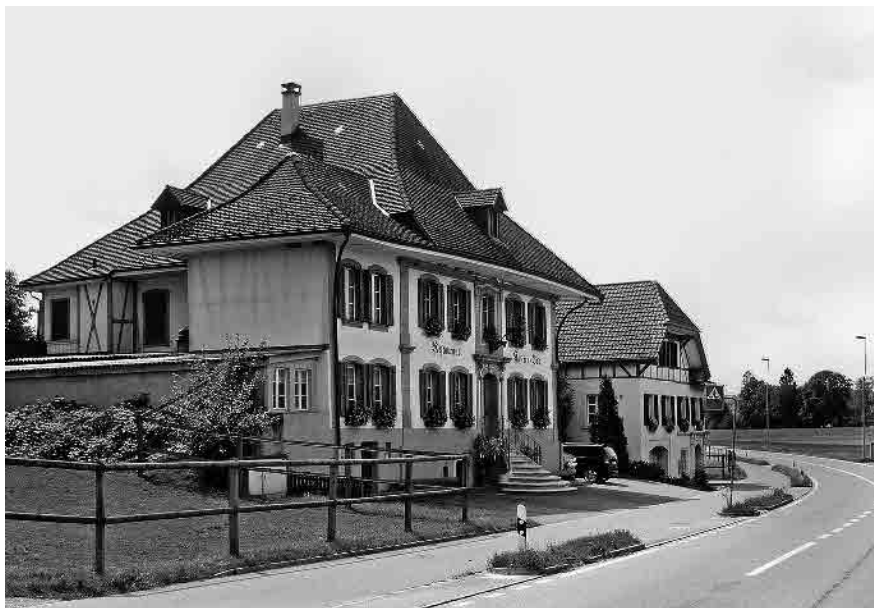
79 Gasthof «Hirschen-Bad»