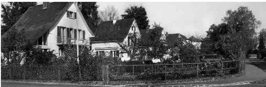
69 Bleichstrasse, 1932