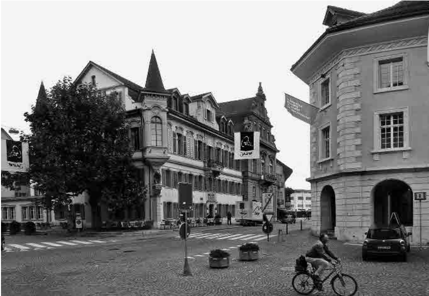
4 Hotel «Bären», 1766/1896