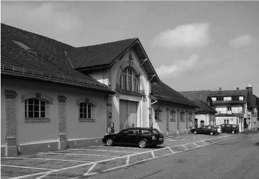
41 Markthalle, 1904