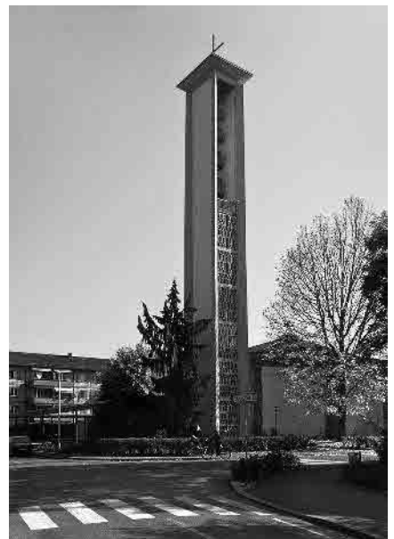
50 Kath. Kirche, 1953/54