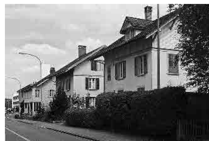
59 Eisenbahnstrasse, Arbeiterhäuser