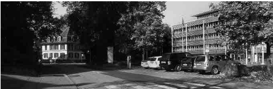
25 Stadthaus, 1990–92