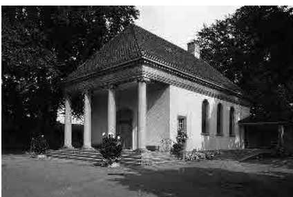
33 Krematorium, 1926