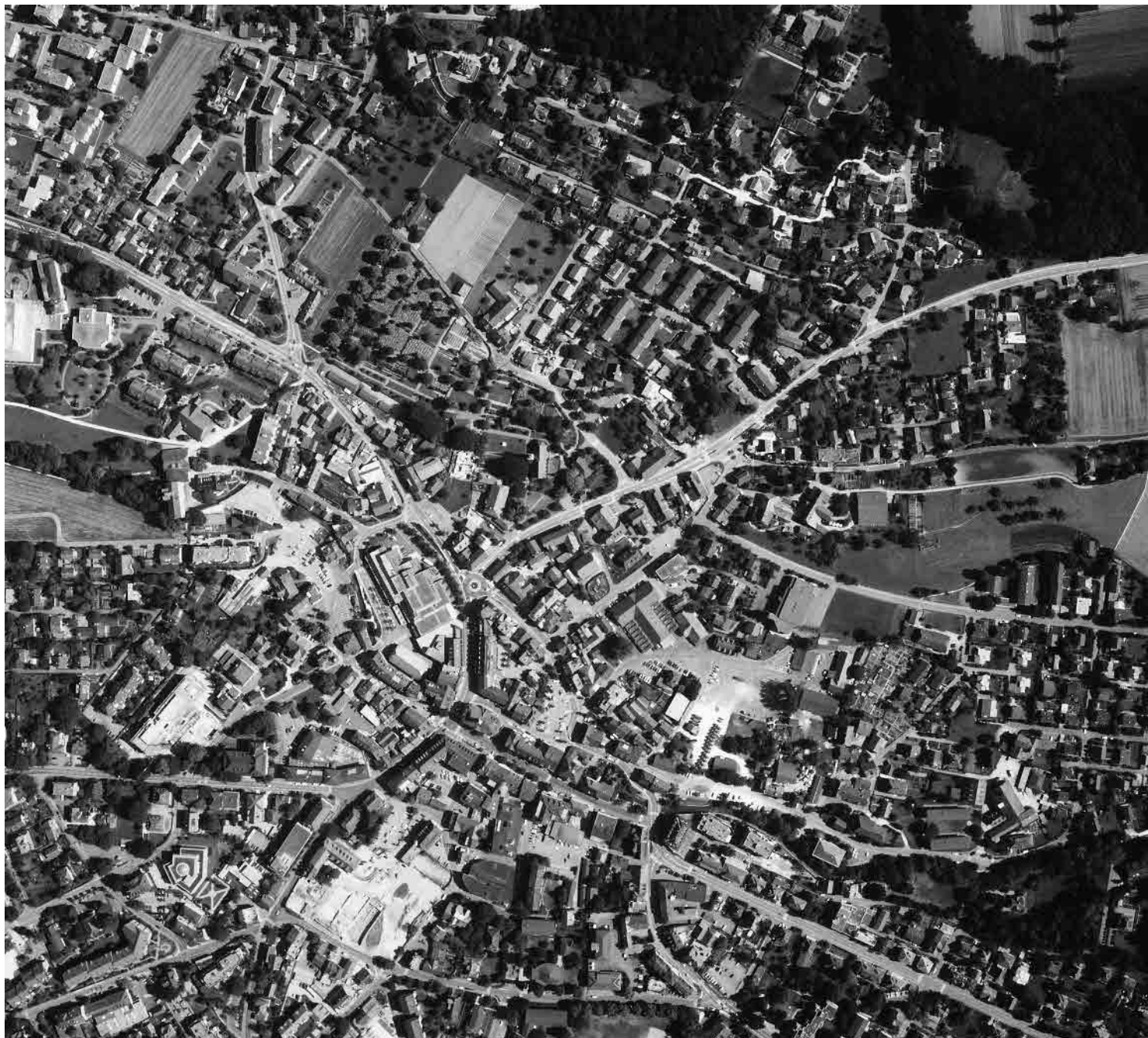
Flugbild 1991, © AGR, Kanton Bern

Dank günstiger Lage im 18. Jh. Entwicklung vom Bauerndorf zum Marktflecken und Handelszentrum des Oberaargaus. Städtische Markt-gasse längs der Langete, markante Hochtrottoirs als Überschwemmungsschutz, Industrie-, Bahnhof- und Villenviertel aus dem ausgehenden 19. Jahrhundert.