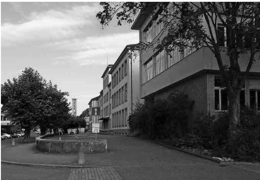
49 Schulhausstrasse, Sekundarschulhaus, ab 1876