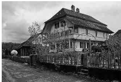
44 Zulauf-Stock, 1807