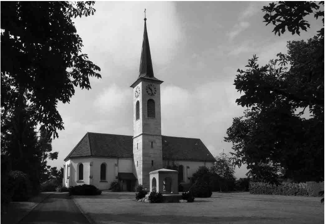
32 Kirche, 1675–78, Turm von 1864, Umbau 1898