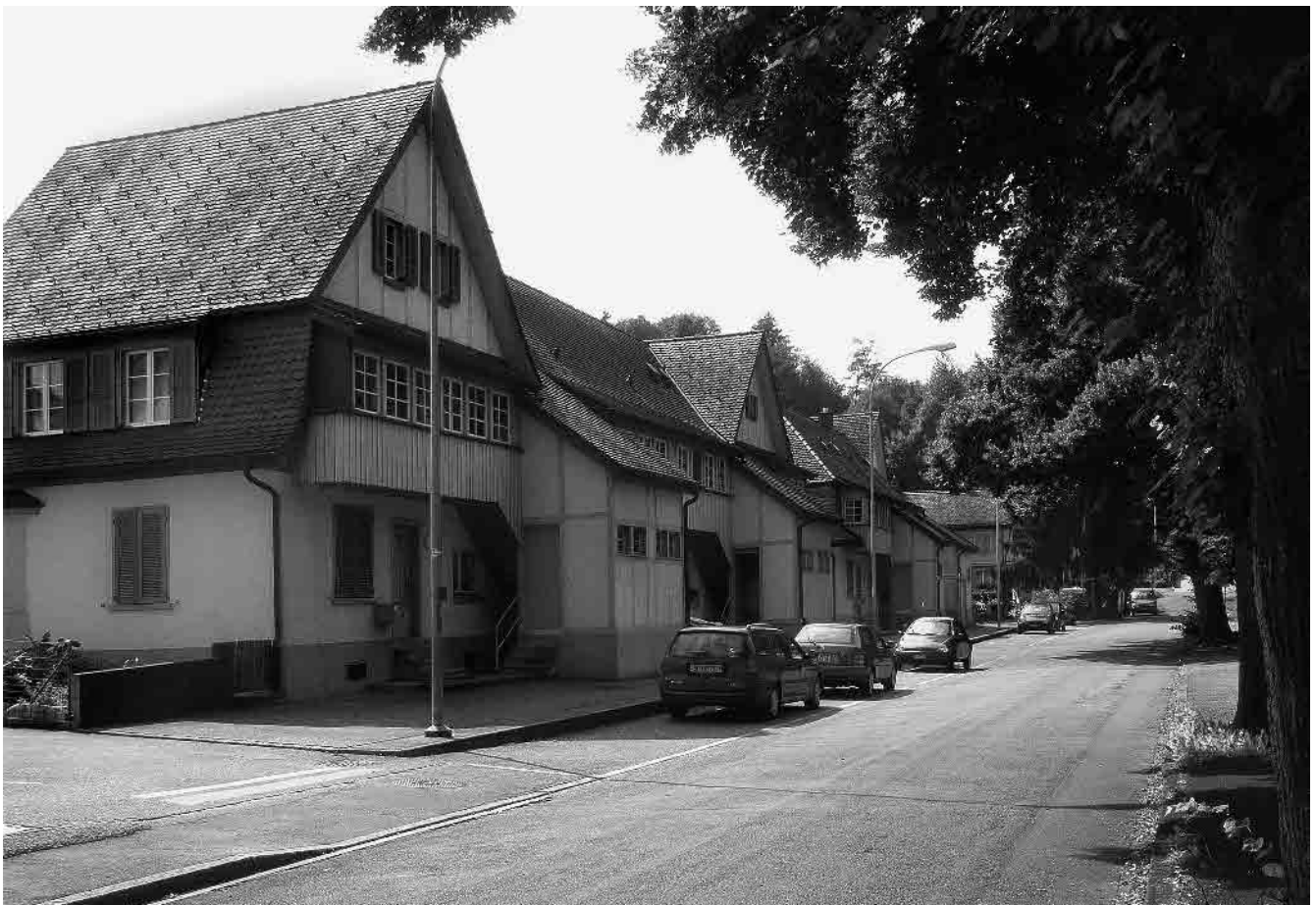
64 Siedlung Halde, 1914-1919