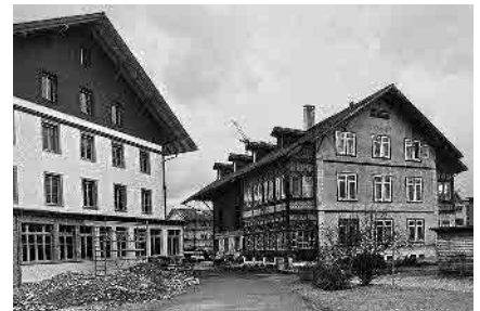
45 Ehem. Thomi-Fabrik, um 1870