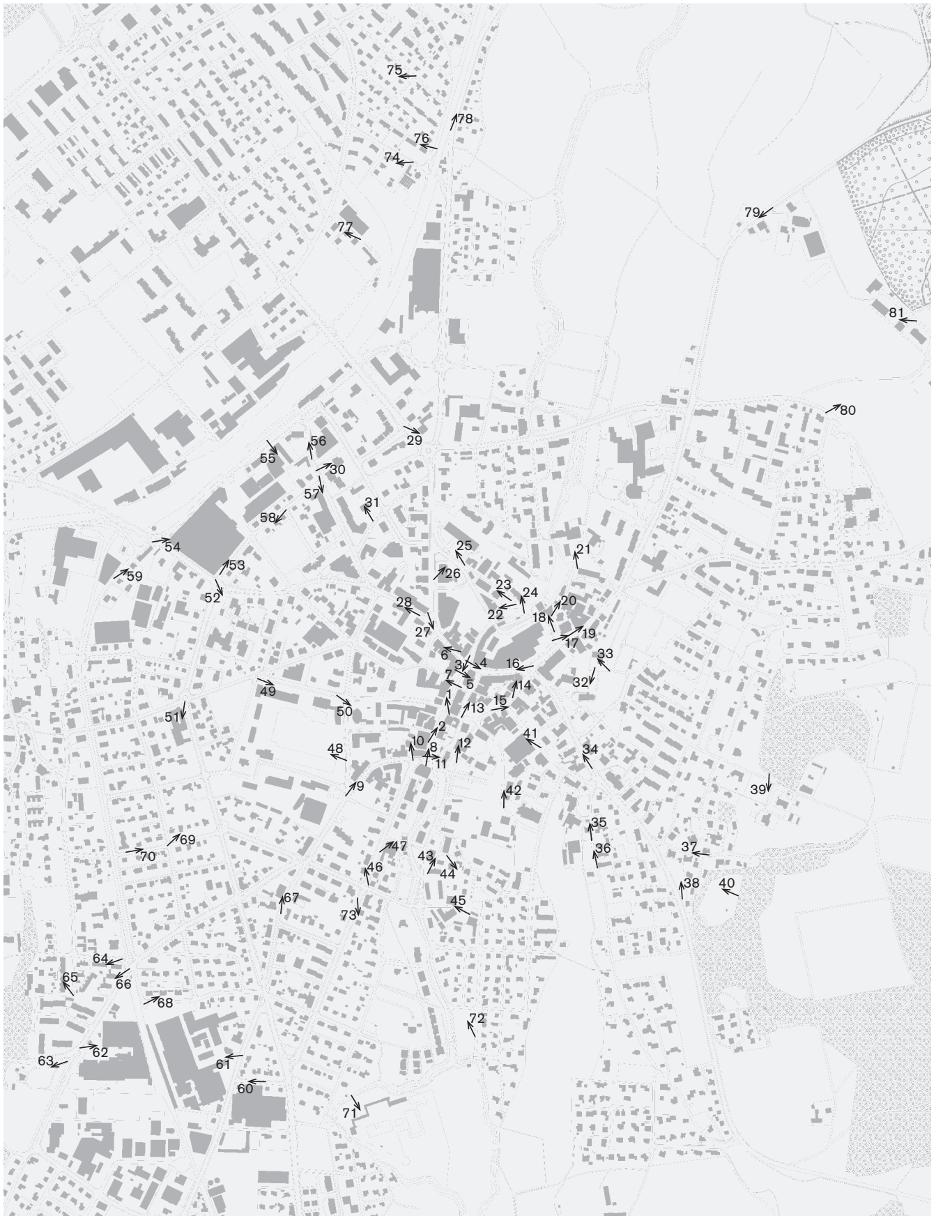
Fotostandorte 1:10 000 Aufnahmen 2007: 1–5, 8–14, 16–38, 40–42, 46–71, 73–79 Aufnahmen 2008: 6, 7, 15, 39, 43–45, 72, 80, 81