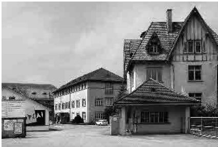
61 Ehem. Porzellanfabrik

Gemeinde Langenthal, Amtsbezirk Aarwangen, Kanton Bern