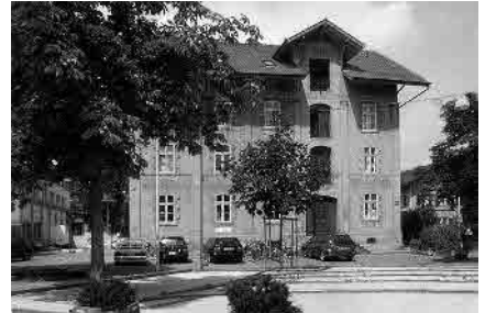
23 Ehem. Fabrikgebäude, 1888