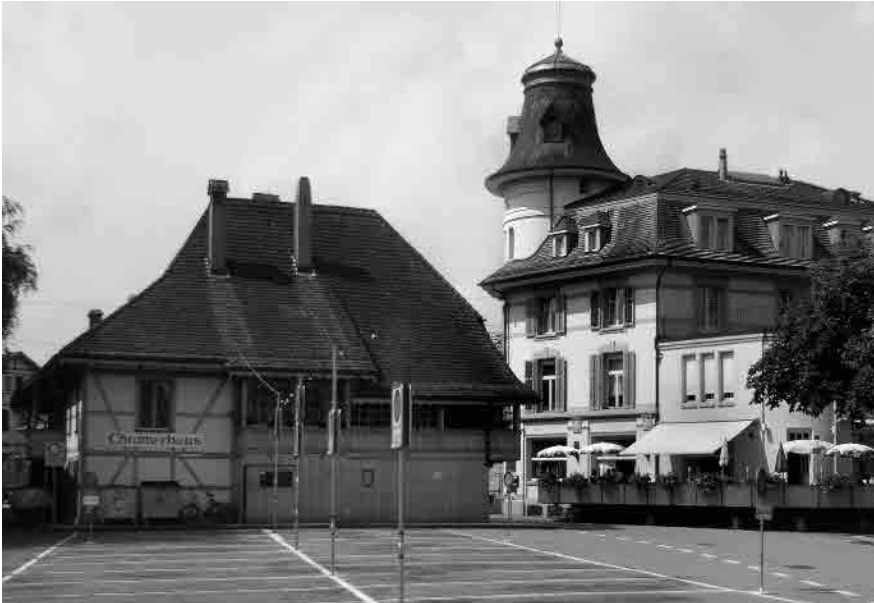
22 Wahrplatz, Chrämerhaus und Turmhaus

Gemeinde Langenthal, Amtsbezirk Aarwangen, Kanton Bern