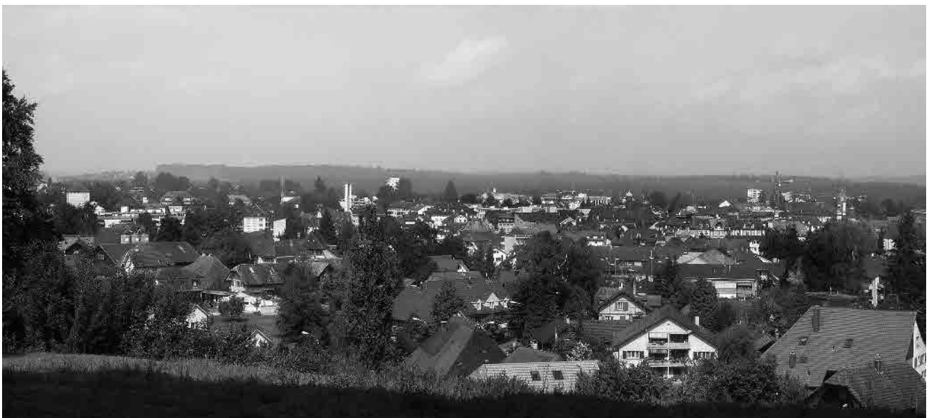
40 Blick vom Greppenweg