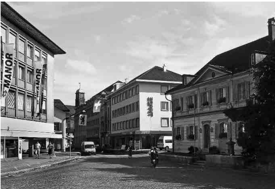
27 Bahnhofstrasse, ehem. Zoll- und Lagerhaus von 1748