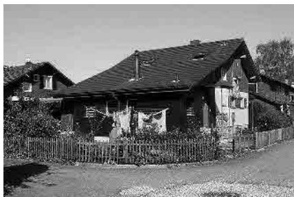
75 Genossenschaft Freiland, 1947