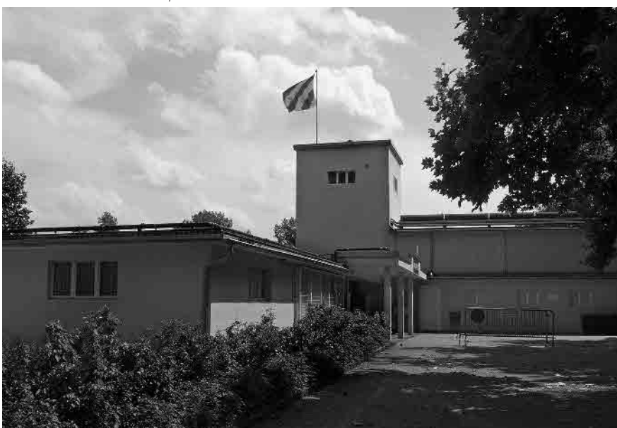
71 Schwimmbad, 1932