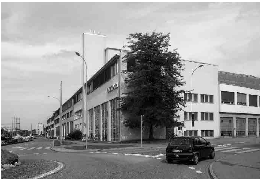
54 Eisenbahnstrasse, Amman AG