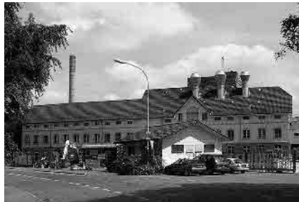
62 Kadi AG