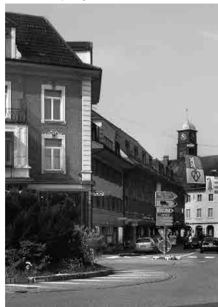
16 St. Urbanstrasse