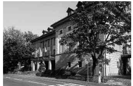
26 Stadttheater, 1914–16