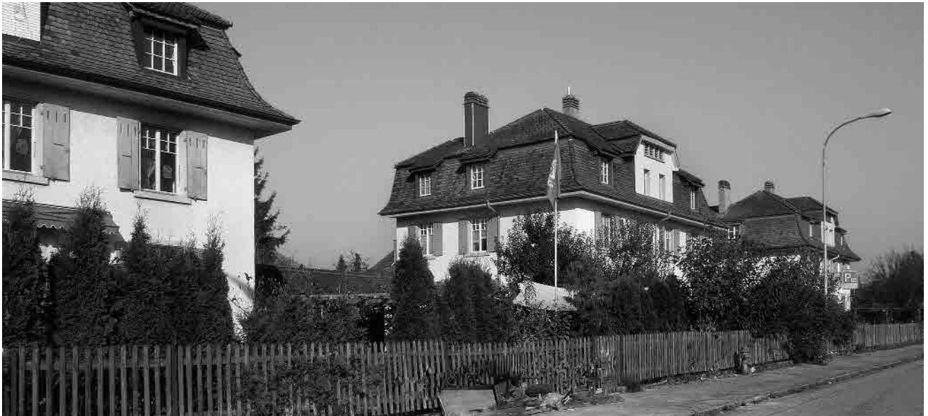
68 Blumenstrasse, 1907