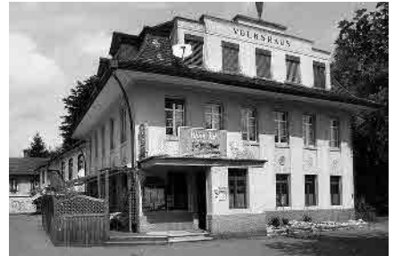
24 Volkshaus, 1926