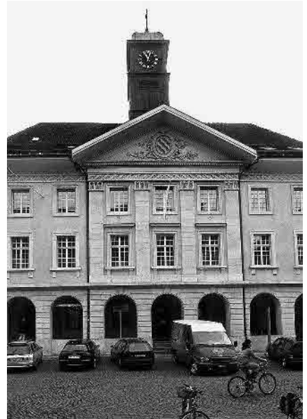
5 Ehem. Kaufhaus, 1790–1810