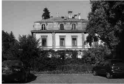
30 Jurastrasse, Villa, vermutl. 1882