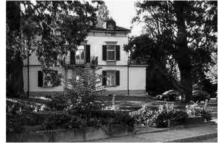
31 Jurastrasse, Villa, vermutl. 1878