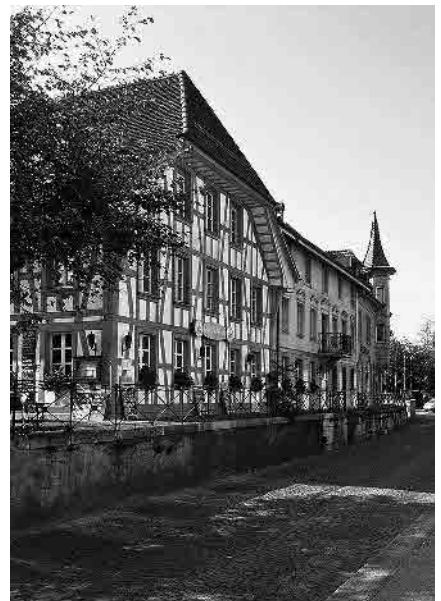
28 Brauihof, 19.Jh.