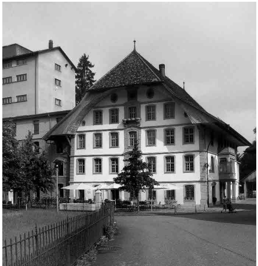
21 Alte Mühle, 1759