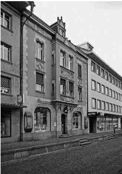
6 Bahnhofstrasse, Haus zum Mohren