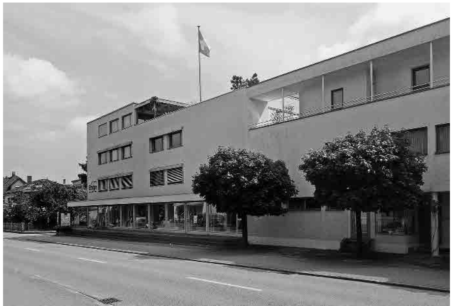
47 Wohn-/Geschäftshaus, 1928–1931