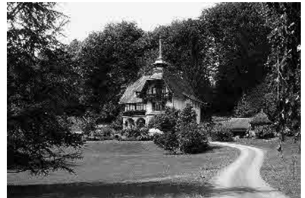
63 Villa Waldheim, 1901