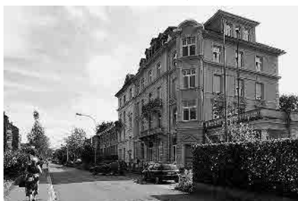
57 Bahnhofstrasse, ehem. Hotel «Jura»