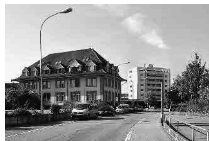
56 Ehem. Amthaus und Bahnhof