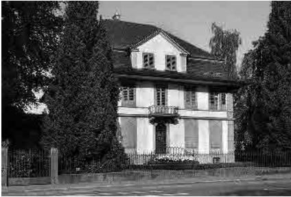
29 Aarwangenstrasse, Villa, um 1870