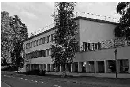
51 Ringstrasse, Geschäftshaus, 1931