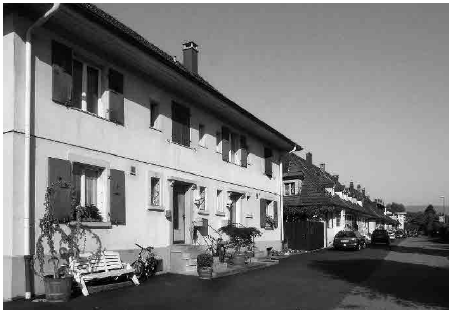
76 Hardastrasse, 1921